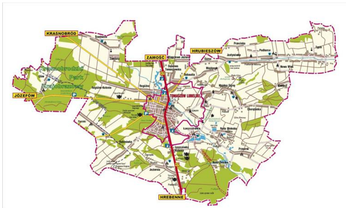
Rys. 2. Mapa gminy Tomaszów Lubelski

Położenie gminy w bezpośrednim sąsiedztwie miasta Tomaszów Lubelski ma swoje konsekwencje związane z tempem i kierunkami rozwoju. Otóż kilka miejscowości: Rogóźno, Łaszczówka, Dąbrowa Tomaszowska, Łaszczówka – Kolonia, Sabaudia, Rabinówka czy Ruda Wołoska bezpośrednio sąsiaduje z miastem. To powoduje, iż ich mieszkańcy związani są raczej z miastem niż miejscowościami, w których faktycznie zamieszkują. Tam znajdują zatrudnienie i korzystają z infrastruktury społecznej. Tereny te są gęsto zabudowane, tracą typowo wiejskie funkcje na rzecz podmiejskich, przestrzennie i funkcjonalnie łączą się z miastem Tomaszów Lubelski. Miejscowości oddalone od miasta posiadają w przeważającym stopniu charakter rolniczy oraz cechują się niższą gęstością zabudowy.