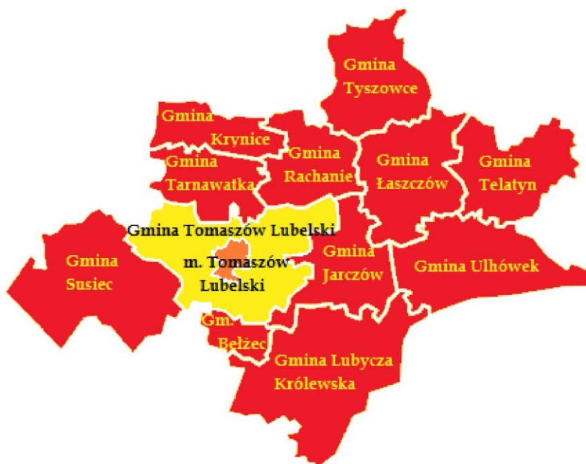
Rys. 1. Lokalizacja gminy w powiecie tomaszowskim

Gmina graniczy z następującymi jednostkami administracyjnymi: